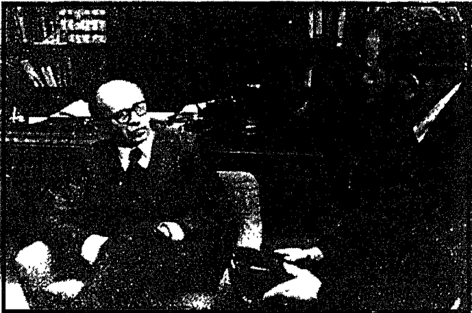
Falwell accepts the opportunity to discuss his views on the state of Israel with Prime Minister Begin.